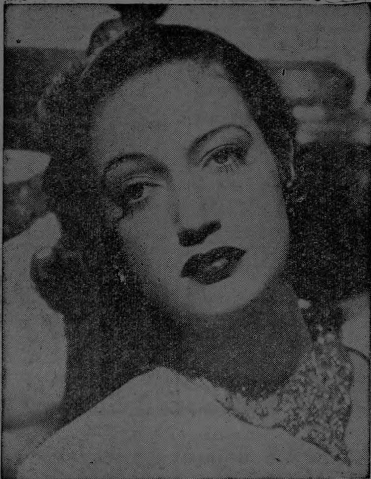
Nunca verá usted en la pantalla la cara de la preciosa DOROTHY LA MOUR, estrella de la Paramount, mostrando señales de fatiga, aunque estrellas como ellas trabajan

Hay que admitir, sin embargo, que en muchas ocasiones un día de trabajo deja rastros de cansancio